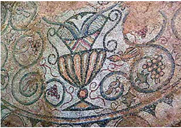
Сл. 31. Мозаик во наосот, поликонхална црква, Плаошник, детал

симболично значење за христијанската литургија, е мошне значајно и затоа што ни открива каков дивеч живеел во овие предели.