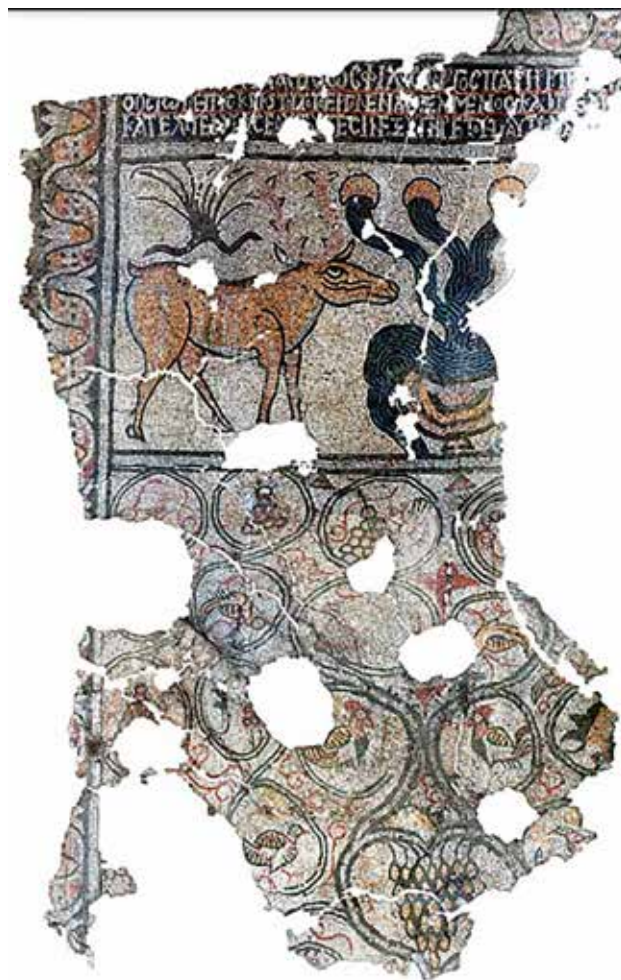
Сл. 33. Поликонхална црква, Плаошник, си. анекс, средишното пано со симболичната илустрација на Четирите рајски реки

Илустрација на винова лоза среќаваме уште на две места на мозаиците од Тетраконхалната црква. Првата илустрација се наоѓа во западната апсида од наосот на црквата (сл.209). Композицијата се состои од централно поставен кантарос од кој израснува винова лоза, со ластари кои се распространуваат симетрично од двете страни на кантаросот и формираат кружни медалјони во кои