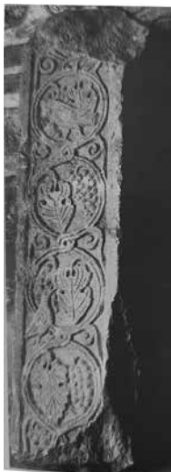
Сл. 2. Олтарски столбчиња, Коњух, ротонда, според К. Петров

Во склоп на олтарната преграда на ротондалната црква од 6 век откриена во с. Коњух, (можеби градот Запапа) С. Радојчиќ објавил неколку столбчиња, од кои едното има во многу плиток рељеф особено квалитетно реалистички изобразени претстави на птици кои колват грозје. Целата претстава од три мали птици, гроздови и големи лозови листови е сместена во кругови врзани со јазол. Самите кругови се всушност образувани од гранки од винова лоза кружно свиткани, од кои излегуваат од двете страни мали спирални кругчиња.