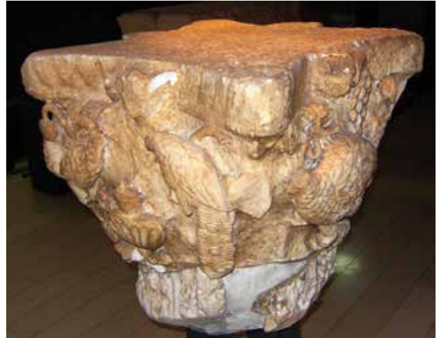
Сл. 14. Епископска базилика, Стоби, фигуративни капители, Народен Музеј, Белград

страна над главите на пауните се грана гранка винова лоза со листови и два гроздови. Материјалот е доломит од Сивец, а димензиите се висина 73 см., абакус 73 см., и дијаметар долу 50 см. (Egger 1929, 48 f. fig. 32; Kitzinger 1946a, 68 cat. 74 fig. 104; Nikolajević–Stojković 1957, fig. 39; Hoddinott 1963, 166, pl. 38 e; Niewöhner – Prochaska 2011, 434- 437, сл 1.; В. Лилчиќ, Македонскиот каменот за боговите , II, 821, 823; Филипова, Рановизантиски капители , кат.бр. 107, 109, стр. 197-199).