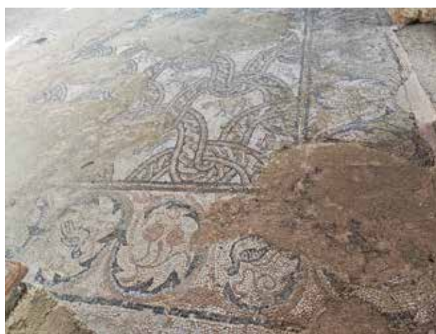
Сл. 30. Мозаик во наосот, поликонхална црква, Плаошник