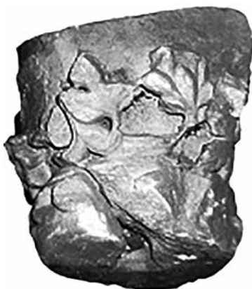
Сл. 20. Депо на Музеј, Завод и Галерија Битола, двозон композитен капител од мермер, з. дел на термите на Хераклеја