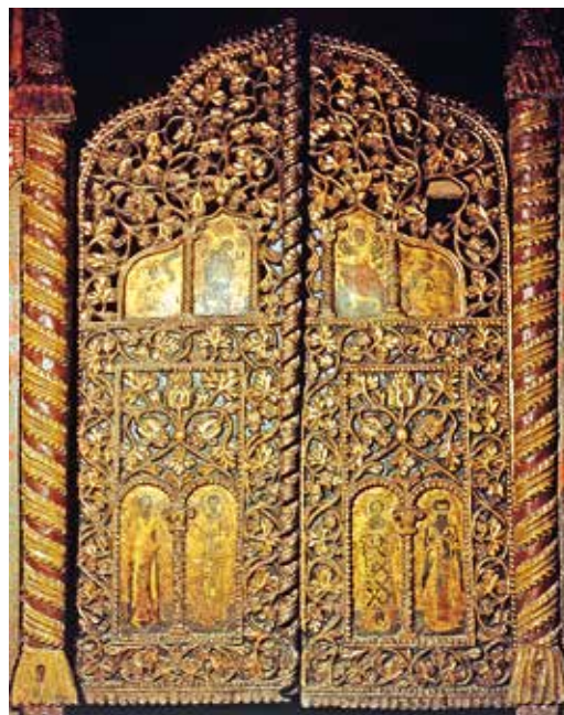
Сл. 22. Св. Наум Охридски, Охрид, царски двери од иконостас, 1711 година

скиот рељеф од Баргала се портретот на Св. Климент, царските двери од Св. Андреја, Матка, како и вратите на Св. Никола Болнички, (14 век) Охрид и иконостасот на црквата Мали Свети Врачи, Охрид. Орнаментите се микс на локални, византиски и западни романички влијанија и користат геометриски, флорални и зооморфни мотиви. Во иконостасите и дверите кои ќе се изработуваат во Македонија и од македоснки резбари низ цел Балкан еден од најдоминантните а понекогаш и единствен мотив е разграната винова лоза со гроздови.