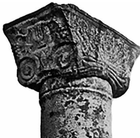
Сл. 3. Епископска базилика, Баргала, јонски импост капител од наосот

Доцноантичкиот град и ранохристијанскиот епископски центар Баргала е откриен и убициран од страна на академик Б. Алексова во 1966 година. На локалитетот во склоп на наосот на епископската базилика пронајдени се зачувани