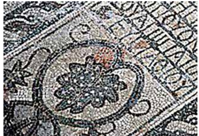
Сл. 34. Старата Епископска базилика, Стоби, ист. дел од наосот, 2/2 на 4 век, натпис за обновата на црквата во време на епископот Евстатиј

кантароси, а на голем број од епитафите се илустрирани и кантароси од кои израснува винова лоза. Претставите на птиците на епитафите имаат јасна фунерарна симболика, ги симболизираат душите на покојниците кои треба да се вознесат на небото. Уметникот што работел во Охрид преку илустрацијата на спокојната атмосфера во која живеат птиците и животните опкружени со разни плодови и растенија, алегорично ја прикажал и последната дестинација на душите - Рајот. Така, верниците коишто влегувале во црквата можеле да ја согледаат евхаристично-есхатолошката конотација на овој мозаички аранжман, кој симболично го прикажува патот на душите на марири-те во Рајот.