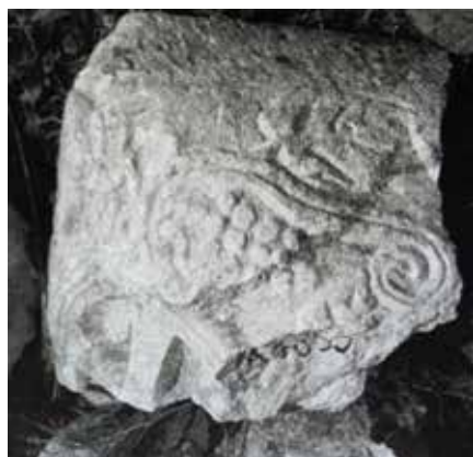
Сл. 11. Епископска базилика во Стоби, импост капител за мено од розев мермер

Зачувани се неколку импост капители за мено од епископската базилика во Стоби, изработени