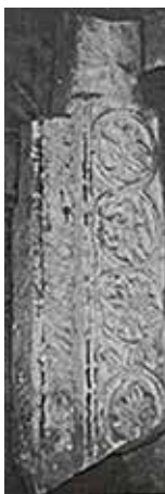
Сл. 21. Св. Софија, Охрид, олтарско столбче, олтарна преграда, 11 век

И во 11 век олтарските столбчиња (2) од олтарната преграда на катедралната црква Св. Софија во Охрид ќе бидат украсени со истатата шема на спирални гранки лоза исполнети со мали птици кои колват грозје, налик на столбчињата од ротондата во Коњух и базиликата во Криви Дол, Аргачи.