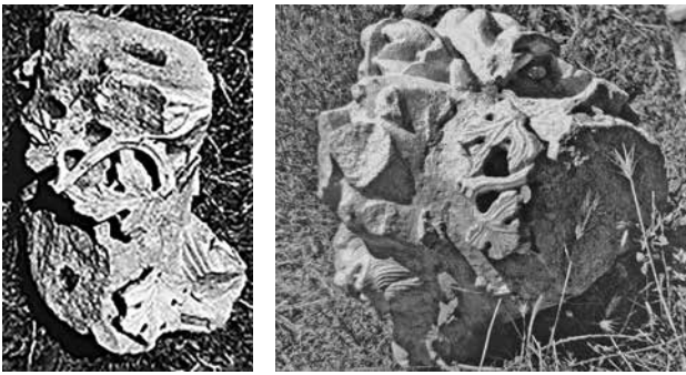
Сл. 6. Капители, Епископска базилика, Баргала Рановизантиски капители , кат.бр. 232-235, страни 291-294).

Од Епископската базилика во Баргала, поточно од канцелот адаптиран во северниот дел на бродот по престанокот на функционирањето на целата базилика во доцниот 6 век потекнува интересна камена плоча. Во средината има крст вметнат под средишната арка. По работ на плочата оди широк фрриз со спирална лозова гранка со листови и гроздови изработена во многу плиток рељеф. Можно е самиот крст да укажува на поседување парче реликвија од светиот крст. Денес е изложен пред Завод, Музејот и Галерија Штип.