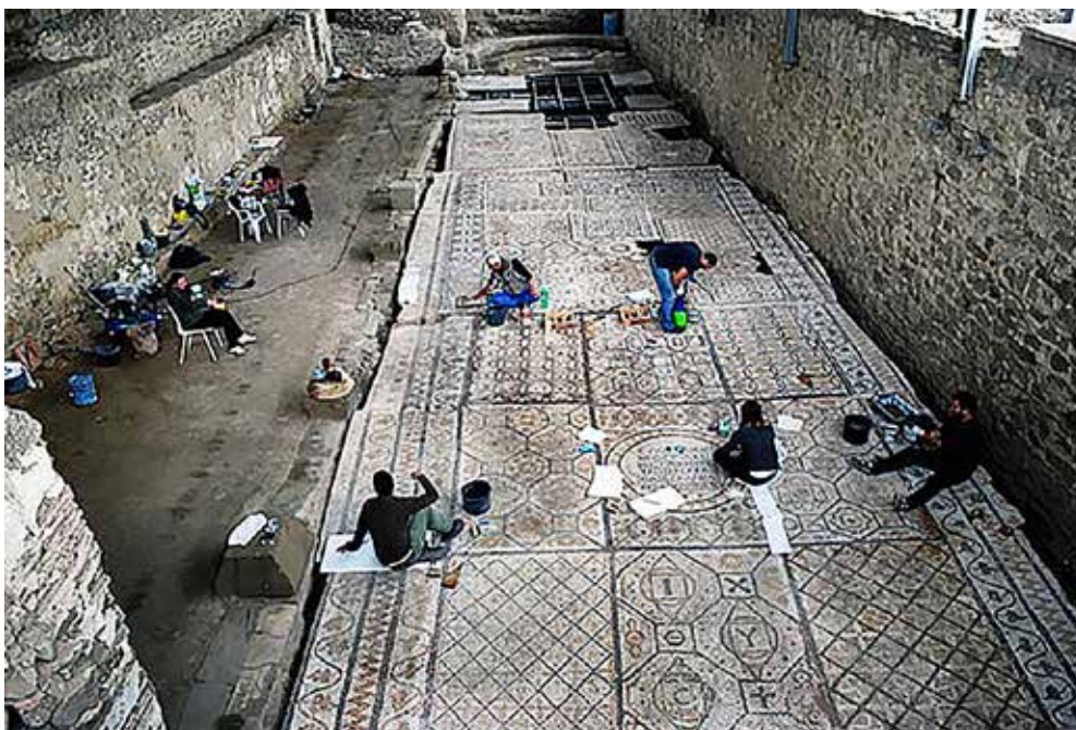
Сл. 35. Старата Епископска базилика, Стоби

Дел од западната мозаична бордура од јужната и северната (многу оштетена) подолжна ивица на северниот брод на старата епископска базилика е изведена со континуирана спирална гранка лоза со наизменично претставени жолтеникаво златни листови и мали златни гроздови.