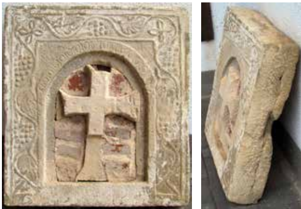
Сл. 7. Камена плоча, Епископска базилика, Баргала

Од Епископската базилика во Баргала, поточно од канцелот адаптиран во северниот дел на бродот по престанокот на функционирањето на целата базилика во доцниот 6 век потекнува интересна камена плоча. Во средината има крст вметнат под средишната арка. По работ на плочата оди широк фрриз со спирална лозова гранка со листови и гроздови изработена во многу плиток рељеф. Можно е самиот крст да укажува на поседување парче реликвија од светиот крст. Денес е изложен пред Завод, Музејот и Галерија Штип.