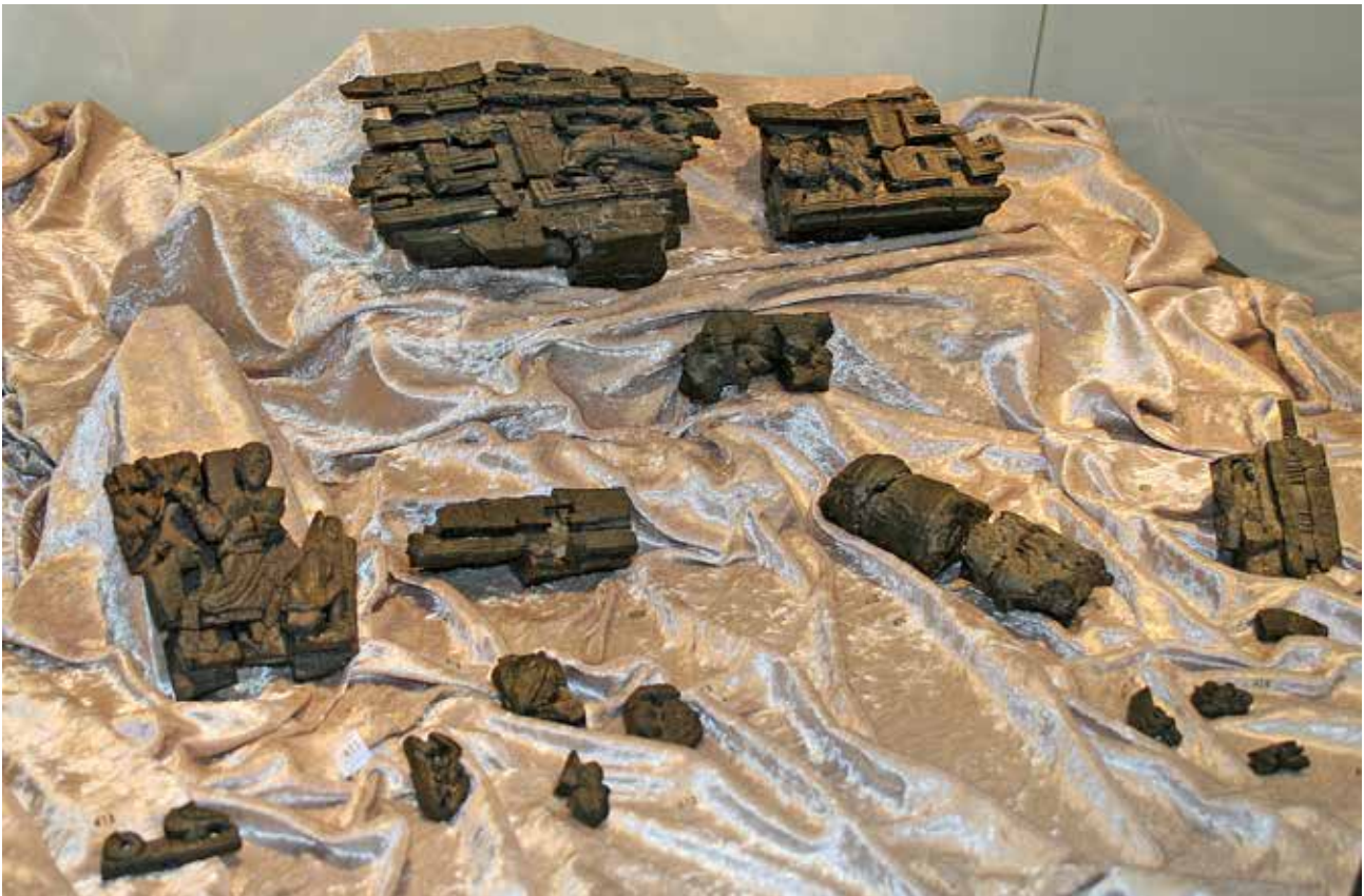
Сл. 5. Фрагменти од дрвен рељеф најдени во термите на Баргала, НУ Завод и Музеј Штип