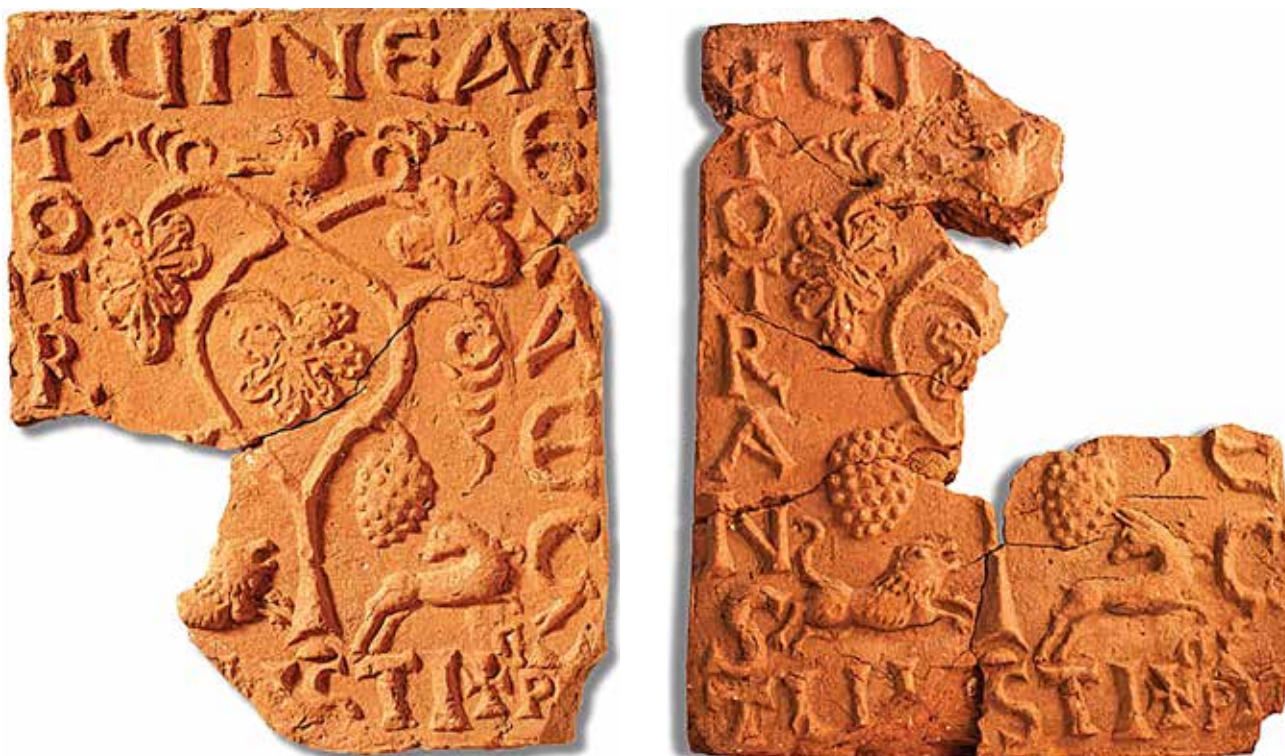
Сл. 1. 79-ти Асафов псалм, Лозовата пенушка претставена на два Винички рељефи

Христовата жртва, неговата пролеана крв и воскресението, се сублимирани во симболичната претстава на виновата лоза, односно во виното како евхаристичка храна за верниците, или според св. Климент Александриски ...Кога велам лоза, мислам алегорично на Господ, од чии плодови мора да јадеме... .