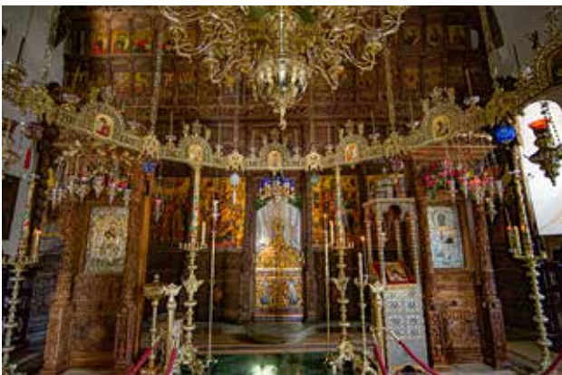
Сл. 27. Св. Јован Бигорски, иконостас, 1830-1835 г.

На една од правоаголните плочи под престолните икони на која се претставени и резбарите со алатките, гледаме двајца стројни мажи кои носат огромен грозд вино. Пред нив е голема птица, а над нив Бог кој преку ангел интервенира во Аврамовата жртва и овенот е веќе донесен да биде замена за Исак. Така овој грозд е симбол на божјата жртва,