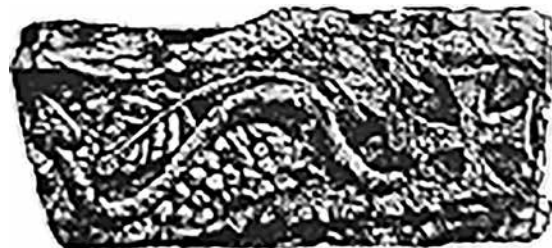
Сл. 4. Епископска базилика, Баргала, фрагментиран корниз