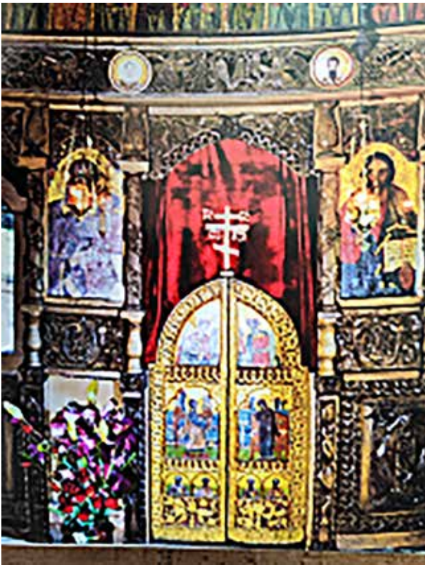
Сл. 23. Св. Атанасиј Александриски, село Журче, 1617 година

крупно грозје. Дверите се позлатени, остатокот од дрворезот не е. И самите столбчиња кои ја држат арката, поставени како продолжеток на дверите се декорирани со спирално извиткани гранки со гроздови и лозови листови.