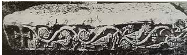
Сл. 12. Епископска базилика во Стоби, задната страна на мермерниот корниз од влезот во базиликата (5ти век)

од розев мермер, од кои неколку на фронталната страна имаат крст со проширени краци впишан во круг, од кој одозгора надолу од страните се извиваат ластери со гроздови и лисја (С. Филипова, Рановизантиски капители , 2006, кат. бр. 57 и 58, страни 152-154).