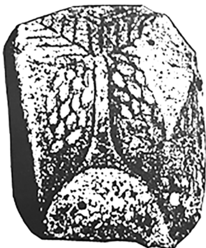
Сл. 16. Дебреште, локалитет “Кале”, прилепско, импост капител од бел мермер