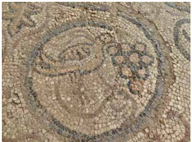
Сл. 32. Мозаик во наосот, поликонхална црква, Плаошник, детал