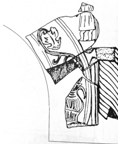
Сл. 8. Остатоци пластика од село Криви Дол, Св. Троица, Аргачи, дел од арка со бокал за вино и гранка винова лоза, а однадвор човечка фигура

Од село Криви Дол, Св. Троица, Аргачи, во 1966 г. се откриени делови од базилика, поточно презвитериум. Пронајдени се делови од иконостас, односно десетина олтарски столбчиња, четири олтарски плочи, олтарна менза со балдахин и арка. Многу интересна е фрагментирана арка со внатрешна ширина од 85 см., поставена над солеата која завршува со бокал за вино од двете страни најдолу, од кој се грана гранка винова лоза (зачуван е само еден лозов лист). Според изведбата ова е подоцнежна фаза на 6 век. Материјалот од базиликата се чува во НУ Завод и Музеј Штип.