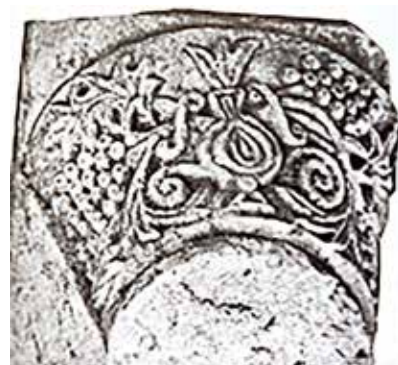
Сл. 15. Северна базилика во Стоби, фрагментираниот корниз од бел мермер

Во с. Дебреште, на локалитетот “Кале”, прилепско пронајден е многу оштетен импост капител од бел мермер. Декорот на зачуваната челна страна покажува стилизирано дрво од кое долу никнат по еден од секоја страна крупни гроздови грозје или можеби урма? Стеблото на дрвото е обликувано како вертикална греда на крст, долу со проширен крак триаголно, а горе истото завршува со гранки во форма на менора (С. Филипова, Рановизантиски капители , кат. бр. 380, страни 399-400).