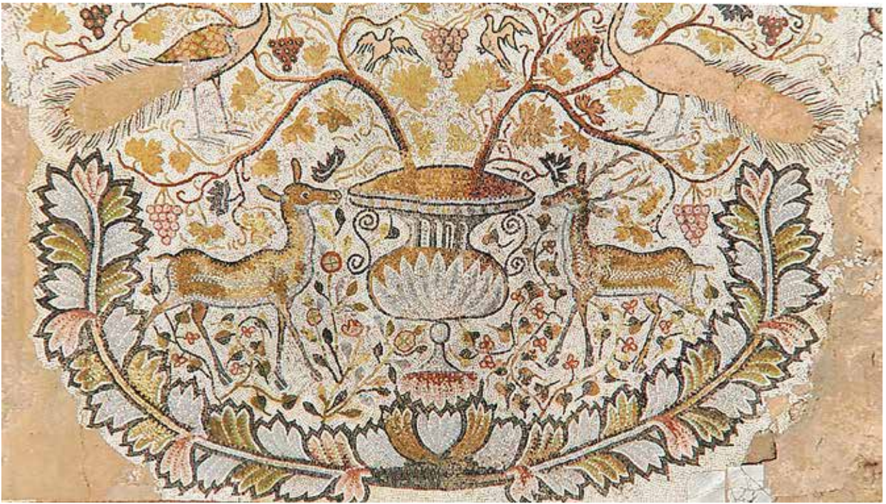
Сл. 29. Хераклеја, нартекст на Големата базилика, прва половина на 6 век, детаљ со елен и срна помеѓу кантарос

состои од 36 осмоаголни полиња поврзани со меандри во орнаментална низа, исполнети со водни животни. Меѓу стеблата од дрвата претставени се цветни грмушки на трендафили, крин и бршлен, како и диви животни.