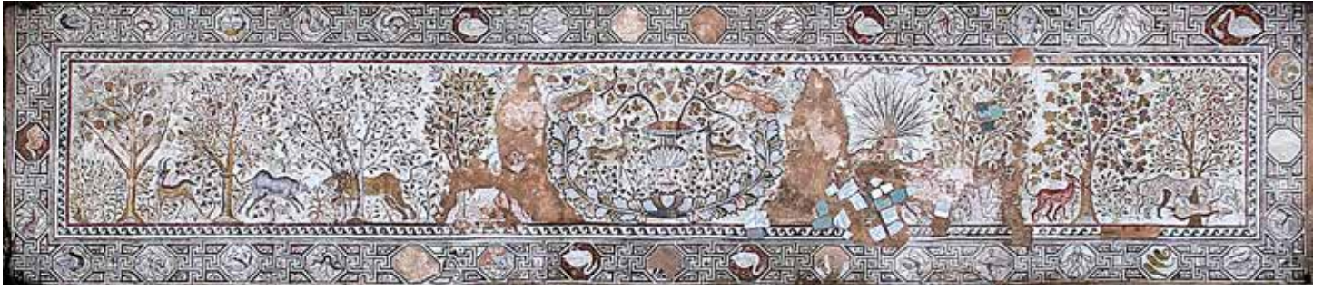
Сл. 28. Хераклеја, нартекст на Големата базилика, прва половина на 6 век

уметност, со својот репертоар и симболика базирана на претходните. Видлива е инспирацијата од еленистичката книжевност кај претставите на градини во нартексот на големата базилика или во претставата на мозаикот од одаја IV во епископската палата. Забележливи се и влијанијата од Рим, Сирија и Александрија. Во 2013 година е откриена нова базилика со мозаици што го зголеми увидот во ателџеата што работеле во градот.