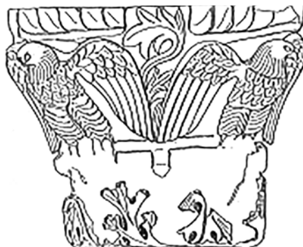
Сл. 18. Фигурален мермерен капител од с. Подлес кај Велес, изложен во Куршумли Ан, Скопје, фото С. Филипова, цртеж Нивес Петров