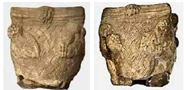
Сл. 9. Корпа капител, Осма базилика, Стоби, 6 век