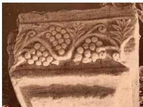
Сл. 13. Северна базилика во Стоби, фрагментираниот корниз од бел мермер

На фрагментираниот корниз од бел мермер од Северната базилика во Стоби се изработени од едната страна неколку гроздови и спирална гранка со ластери и листови кои не се толку уверливи како да се од лоза, повеќе се налик на палмино дрвце (С. Филипова, Архитектонска декоративна скулптура , Т XXXI сл. 1).