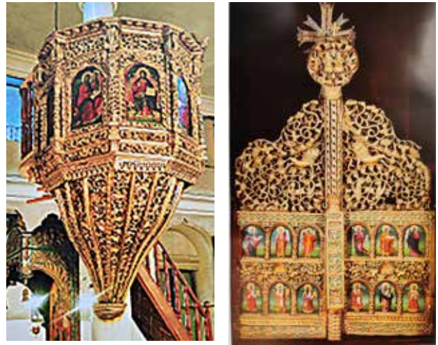
Сл. 24. Св. Димитриј во Битола, амвон и царски двери, 1830 година

Во оваа базилика е поставен грандиозен иконостас кој е еден од најголемите на Балканот. Поделен е хоризонтално и вертикално на три делови споени во една целина. Работен е со беспрекорна прецизност, трпение и посветеност, и го покажува исклучителното мајсторство на дрворезбарската тајфа која поседувала не само огромен талент, туку и теолошко знаење. Иконостасот на црквата Св. Димитрија е своевиден балкански барок кој покажува дека контактите со Европа биле директни, творечки и инспиративни, комбинирани со богатата традиција. Прекрасната изведба на лозови гранки со гроздови и листови е присутна низ дверите со маркантните лавови во горниот дел работени во ажур од непознат Епирски мајстор (19 век), и низ целиот дрвен позлатен амвон и делува како кошница што лебди. На дверите од 1738 година лозови гранки со гроздови и листови од кои колват птици се алтернирани со гранки со цветови. (Д. Корнаков, Бисери на македонската резба , Скопје 2009, 60, 82-83)