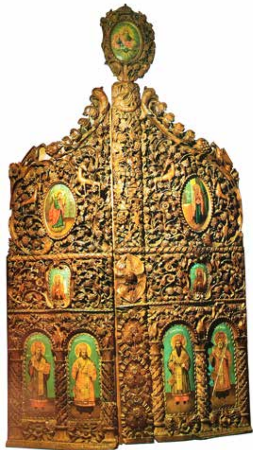
Сл. 25. Св. Богородица, Ново Село, Штип, царски двери, 19 век

Лозата со гроздови е присутна и како декоративен мотив на дверите од Св. Богородица, Ново Село, Штип (19 век) комбинирана со расцветани цветови. Доминантен и единствен мотив е на горниот дел од гредата на средината на дверите, и по горните рабови од двете каде еден гулаб колве еден грозд, а работен е во висок релјеф, практично како слободна скулптура која само со нозете и врвот на опашката се допира за ивицата.