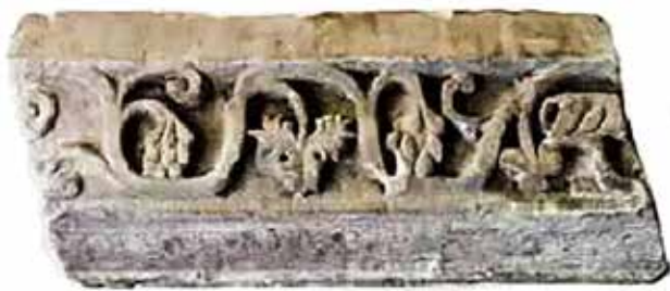
Сл. 10. Епископска базилика во Стоби, оградата околу платформата на амвонот (5-ти век)