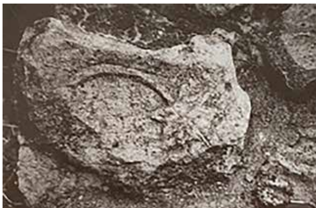
Сл. 17. Фрагментиран капител сполија во плато од Св. Никола, село Крупиште

Овој фрагментиран капител бил секундарно вграден како сполија во цементирано плато северно од црквата Св. Никола, село Крупиште, во близина на Штип. Видлив е само горниот дел (0,29x0,33) со деталот на гранка со лозов лист. Многу слична претстава е зачувана на импост капителот од Црквиште, Мородвис (С. Филипова, Рановизантиски капители , кат. бр. 235, страна 307).